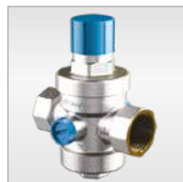
3110N Riduttore di pressione Pressure reducing valve