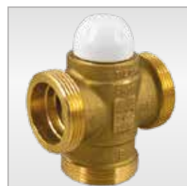
3890VD Valvola miscelatrice/ deviatrice Three-way thermostatic diverting/ mixing valve