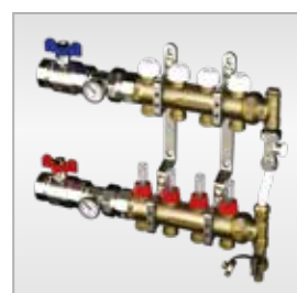
3877 Collettore di distribuzione da 1"1/4 Distribution manifolds 1"1/4