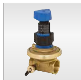
6538 Valvola di bilanciamento con controllo pressione differenziale Balancing valve with differential pressure control