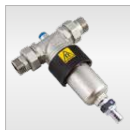
3149 Filtro defangatore magnetico Magnetic dirt separator